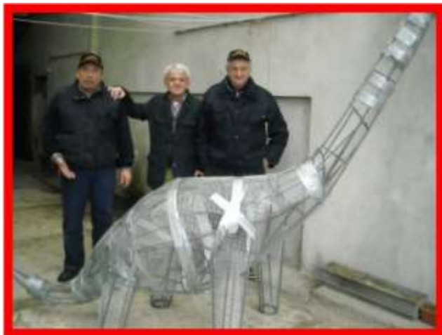
I mitici nonni preparano la struttura