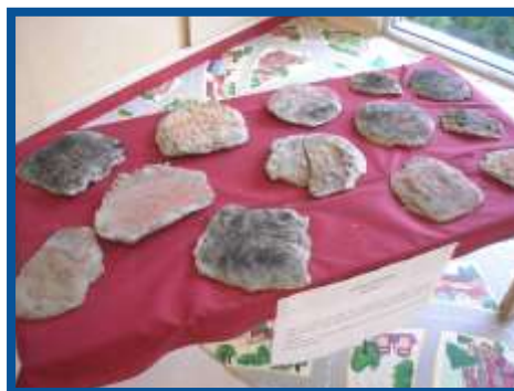
L'ARTE PRIMITIVA: I GRAFFITI...