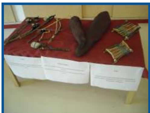
TELAI E STOVIGLIE.....