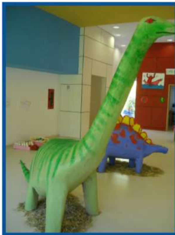
I bambini le ricoprono con colla e carta da giornale poi colorano