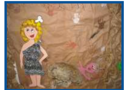
LA MACCHINA DEL TEMPO...