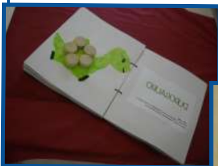
I NOSTRI LIBRI